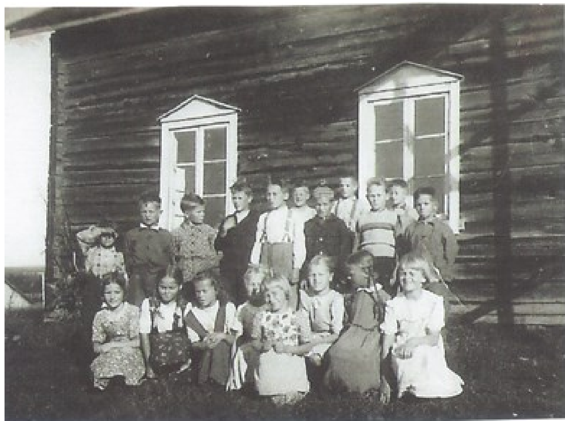
Kansakoululaisia, taustalla Hietalan pirtti